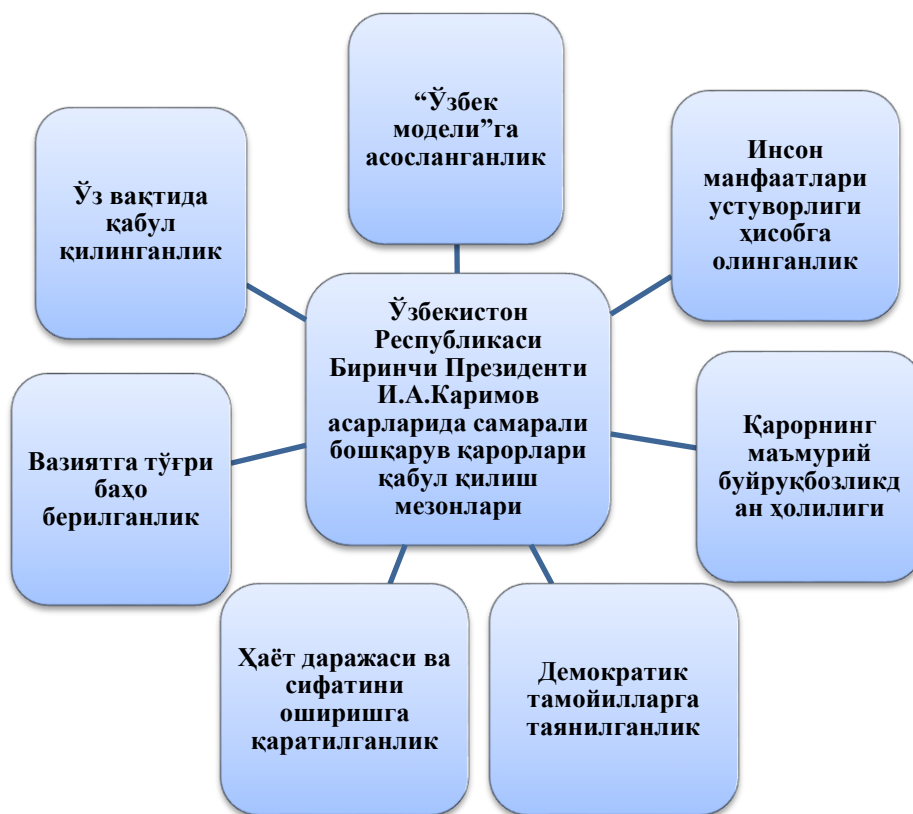
1-расм. Ўзбекистон Республикаси Биринчи Президенти И.А.Каримов асарларида самарали бошқарув қарорлари қабул қилиш мезонлари

қабул қилишда масъулият ва жавобгарликни ўз зиммасига олиш, принципиаллик хусусиятлари бўлиши талаб этилади (1-расм).